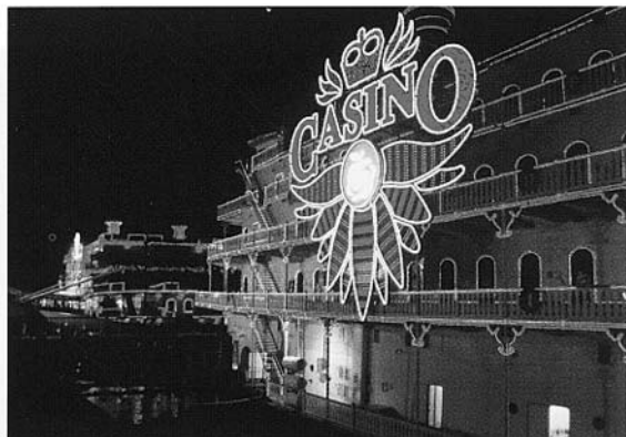
Vista de los dos barcos en Puerto Madero

agosto de 1999, es por 15 años prorrogables por otros 5.