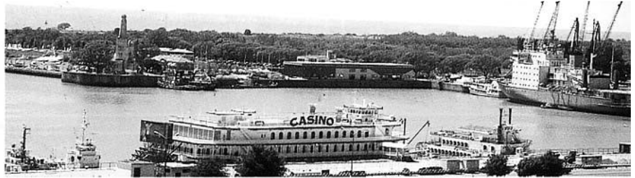
El "Estrella de la Fortuna" en su primitiva ubicación

Desde hace algunas fechas el "Estrella de la Fortuna" está acom-