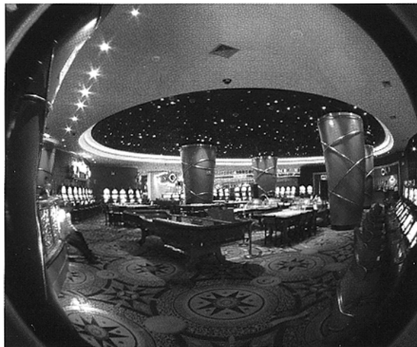
Vista interior del Casino Majestic Lima

En la reunión se evaluaron los resultados de la corporación en 2005 y las proyecciones para el resto de 2006, en donde Cirsa