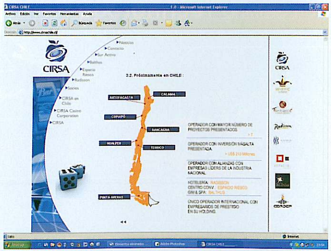
Mapa de Chile con las ciudades en las que Cirsa ha presentado una propuesta

Página principal de la Web de Cirsa Chile: www.cirsachile.cl